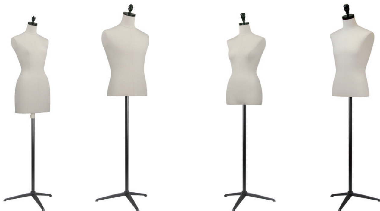
SL0895A-1KA カツラギ Head:H-101アンティーク ラックφ8.4 Base:B-205 黒 B:81 W:58 H:85 高さ:79 肩幅:38

Studio Body studiobodyのラインナップはP.10~11に掲載