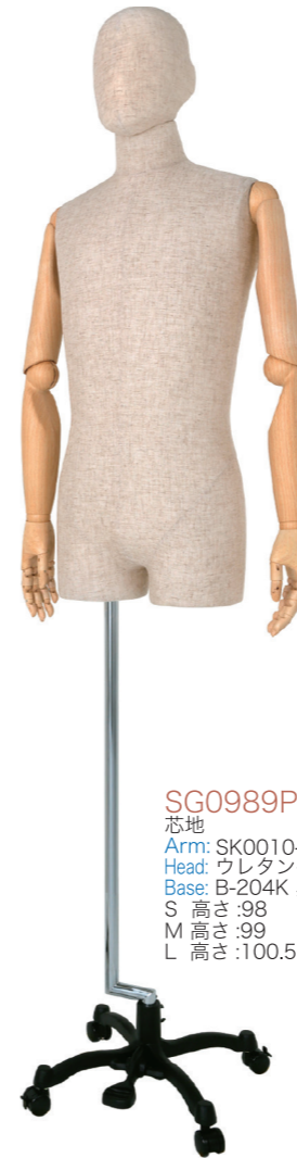
SG0989P-1C 芯地 Arm: SK0010-2 Head: ウレタンヘッド 芯地 Base: B-204K 黒 S 高さ:98 B:89 W:77 H:93 肩幅 43 M 高さ:99 B:93 W:80 H:94 肩幅 46 L 高さ:100.5 B:95 W:81 H:95 肩幅 46