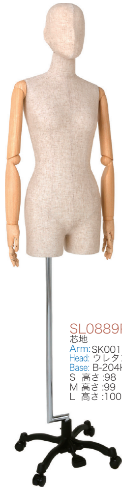
SL0889P-1C 芯地 Arm: SK0011-2 Head: ウレタンヘッド 芯地 Base: B-204K 黒 S 高さ:98 B:77 W:57 H:84.5 肩幅 39 M 高さ:99 B:81 W:61 H:86.5 肩幅 40 L 高さ:100 B:83 W:63 H:89 肩幅 41