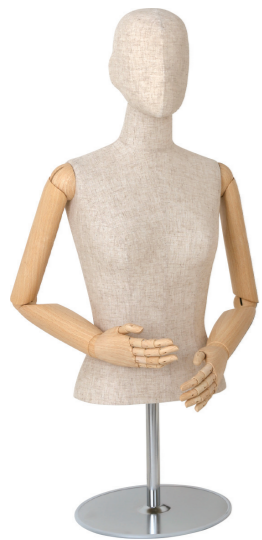
SL0889P-2C 芯地 Arm: SK0011-2 Head: ウレタンヘッド 芯地 Base: B-46 S 高さ:75 B:77 W:57 肩幅 39 M 高さ:76 B:81 W:61 肩幅 40 L 高さ:77 B:83 W:63 肩幅 41