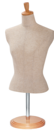
SL0880A-2C 芯地 Arm: なし Head: H-53 クリア Base: B-61 クリア S 高さ:55 B:77 W:57 肩幅 38.5 M 高さ:56 B:81 W:61 肩幅 39.5 L 高さ:57 B:82 W:63 肩幅 40