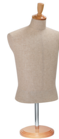
SG0980A-2C 芯地 Arm: なし Head: H-57 クリア Base: B-61 クリア S 高さ:60 B:89 W:77 肩幅 43 M 高さ:60 B:93 W:80 肩幅 44 L 高さ:60 B:95 W:81 肩幅 46