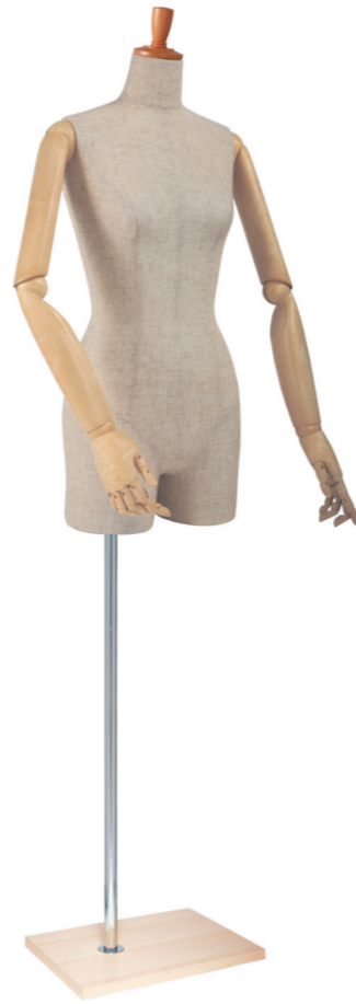
SL0883P-1C 芯地 Arm: SK0011-2 Head: H-53 クリア Base: B-94 クリア S 高さ:78 B:77 W:57 H:84.5 肩幅 39 M 高さ:79 B:81 W:61 H:86.5 肩幅 40 L 高さ:80 B:83 W:63 H:89 肩幅 41