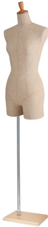
SL0880A-1C 芯地 Arm: なし Head: H-53 クリア Base: B-63 クリア S 高さ:78 B:77 W:57 H:84.5 肩幅 38.5 M 高さ:79 B:81 W:61 H:86.5 肩幅 39.5 L 高さ:80 B:82 W:63 H:89 肩幅 40