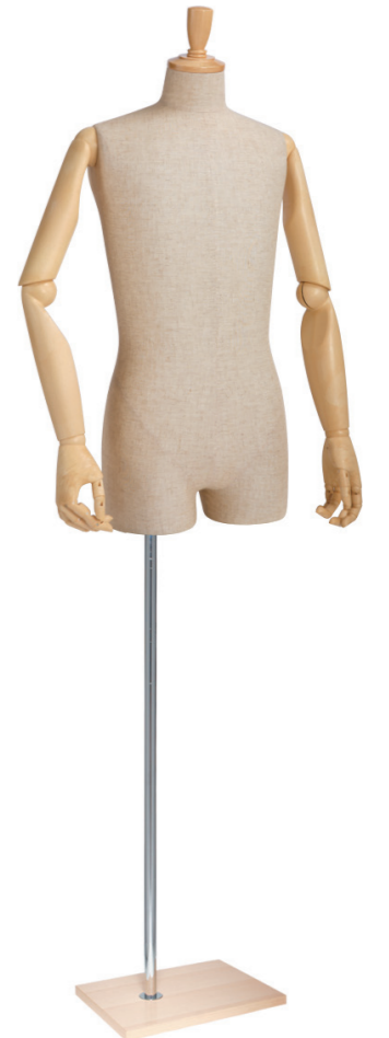
SG0983P-1C 芯地 Arm: SK0010-2 Head: H-57 クリア Base: B-94 クリア S 高さ:80.5 B:89 W:77 H:93 肩幅 43 M 高さ:81.5 B:93 W:80 H:94 肩幅 46 L 高さ:82 B:95 W:81 H:95 肩幅 46