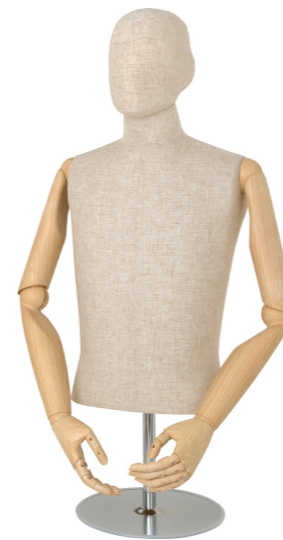
SG0989P-2C 芯地 Arm: SK0010-2 Head: ウレタンヘッド 芯地 Base: B-46 S 高さ:78 B:89 W:77 肩幅 43 M 高さ:78 B:93 W:80 肩幅 46 L 高さ:78 B:95 W:81 肩幅 46