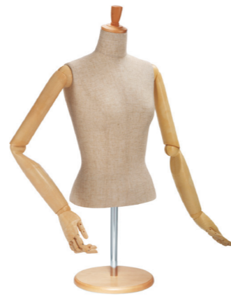
SL0883P-2C 芯地 Arm: SK0011-2 Head: H-53 クリア Base: B-43 クリア S 高さ:55 B:77 W:57 肩幅 39 M 高さ:56 B:81 W:61 肩幅 40 L 高さ:57 B:83 W:63 肩幅 41