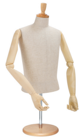
SG0983P-2C 芯地 Arm: SK0010-2 Head: H-57 クリア Base: B-43 クリア S 高さ:60 B:89 W:77 肩幅 43 M 高さ:60 B:93 W:80 肩幅 46 L 高さ:60 B:95 W:81 肩幅 46