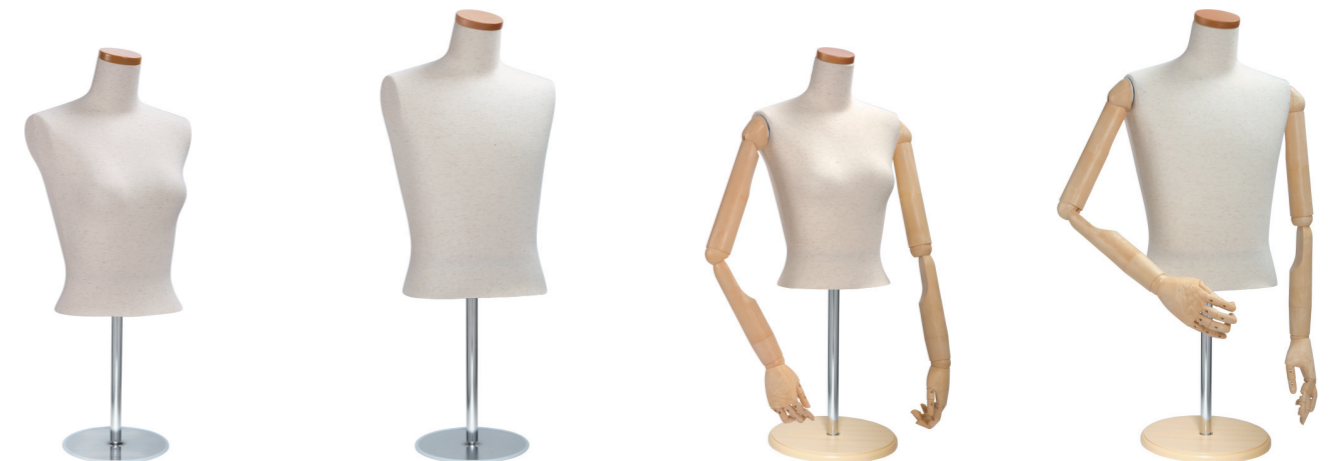
SL0850A-2N 芯地 Arm: なし Head: H-63 クリア Base: B-16B S 高さ:53 B:77 W:56 肩幅 34.5 M 高さ:56 B:82 W:61 肩幅 38 L 高さ:56 B:88 W:67.5 肩幅 40