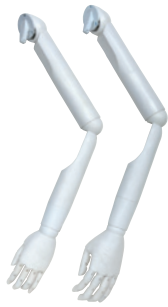
樹脂：白 ● SK0050-1 Men's ● SK0060-1 Lady's