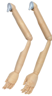
樹脂：アイボリー ● SK0050-2 Men's ● SK0060-2 Lady's