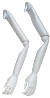
樹脂：白 ● SK0010-1 Men's ● SK0011-1 Lady's