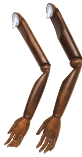
樹脂：ブラウン ● SK0010-3 Men's ● SK0011-3 Lady's