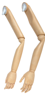
樹脂：アイボリー ● SK0010-2 Men's ● SK0011-2 Lady's