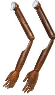
樹脂：ブラウン ● SK0050-3 Men's ● SK0060-3 Lady's