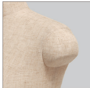
SK004 : Men's SK003 : Lady's

布貼りの場合は布地の指定のご相談をお願いします。 ラッカー塗装の場合は塗装のご指示をお願いします。