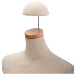
SK103 子供用 φ12cm