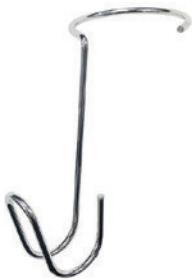
SK212 アーム用バッグ掛けクローム