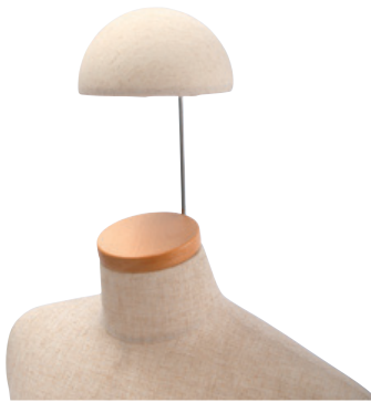
SK102 大人用 φ15cm