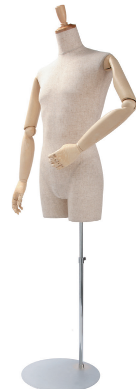
SGB007P-1C 芯地 Arm: SK0010-2 Head: H-57 クリア Base: 専用丸スタンド 高さ :90 B:94 W:75 H:91 肩幅 54.5