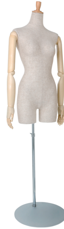
SLB003P-1C 芯地 Arm: SK0011-2 Head: H-53 クリア Base: 専用丸スタンド 高さ :81 B:82 W:57 H:85 肩幅 47