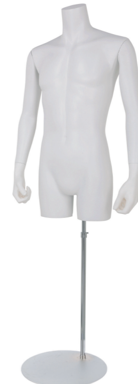
SGB005K-1W ラッカー (白) Arm: 右直・左直 Head: なし Base: 専用丸スタンド 高さ :91.5 B:94.5 W:76 H:91 肩幅 50