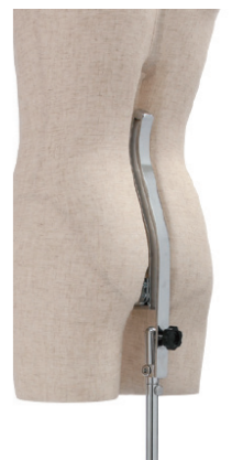
バックスタンド構造 傾き調整機能付き