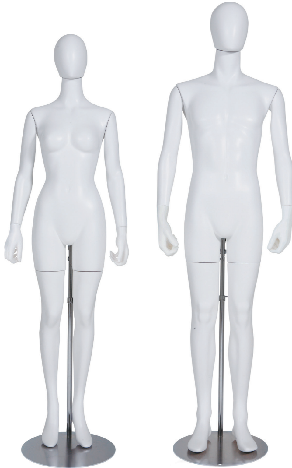
SLB002K-1W-H-RL ラッカー (白) Arm: 右直・左直 Head: オーバルヘッド Base: 専用丸スタンド 高さ :176 B:82 W:57 H:85 肩幅 42

美しく進化し続けるバックスタンドボディに、オーバル型ヘッドとリアルレッグをプラス。 フェイスアイテムからレッグアイテムまで、ファッションナブルかつ機能的にコーディネートできるように追究いたしました。