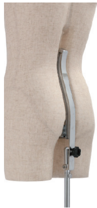
バックスタンド構造 傾き調整機能付き